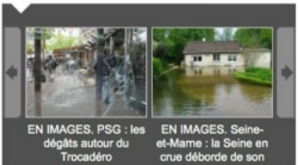
EN IMAGES. PSG : les dégâts autour du Trocadéro