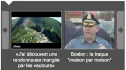
«J'ai découvert une randonnée mangée par les vautours»